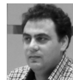
Δρ. Μάριος Τσιώνιας Πρόεδρος ΔΣ HELGRAMED, Επίκουρος Καθηγητής Πανεπιστημίου Δυτικής Αττικής