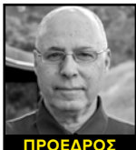
ΠΡΟΕΔΡΟΣ Δρ. Αναστάσιος Ε. Πολίτης Πρόεδρος της Κριτικής Επιτροπής, Καθηγητής στην Επιστήμη και Τεχνολογία Γραφικών Τεχνών