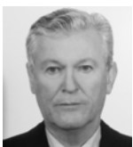
Δρ. Πόθης Ν. Παπαδάκος Μηχανικός του ΕΜΠ, Ομότιμος Καθηγητής ΤΕΙ