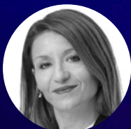
Σίσσυ Λιγνού AFEA S.A. TRAVEL & CONGRESS SERVICES